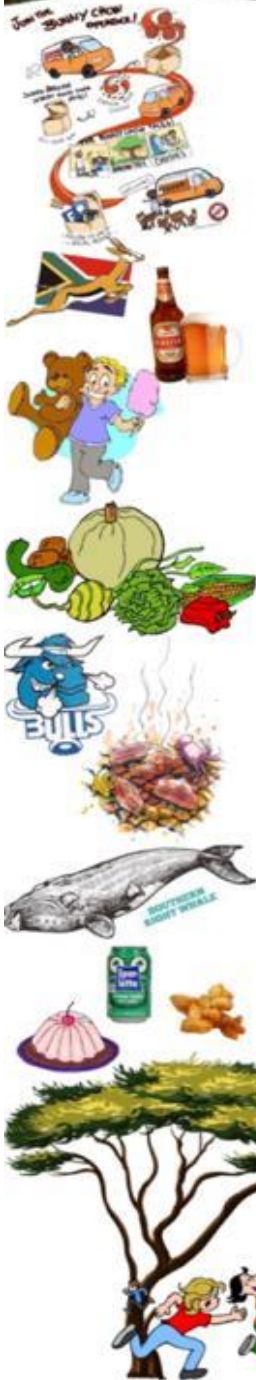
PHOTO BOOTH PEDDLE CARS TREASURE HUNT